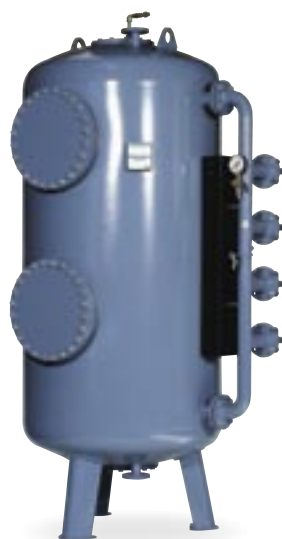
TFB 14 típusú nyomáscsűrítő berendezés.

Fordított ozmózis berendezések gyártás közben, boiler tápvíz kezeléshez, egy gyógyszergyár részére.