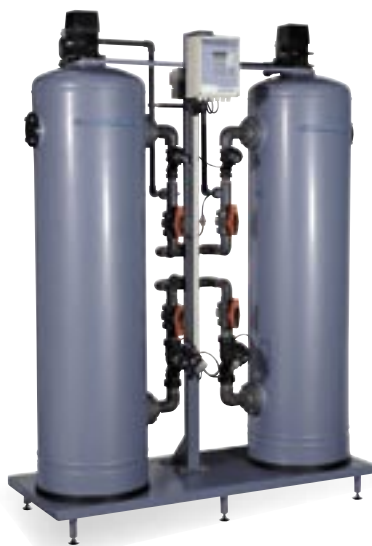
SMH 602 típusú vízlágyító berendezés.