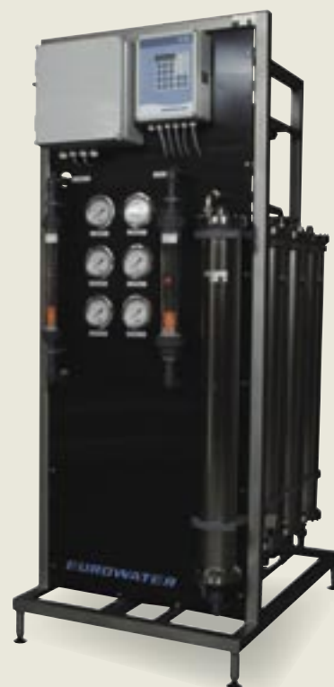
Keretre szerelt CU:RO kompakt egység; Egy teljes fordított ozmózis rendszer Integrált előkezelő berendezéssel, Rozsdamentes kereten – használatra kész.